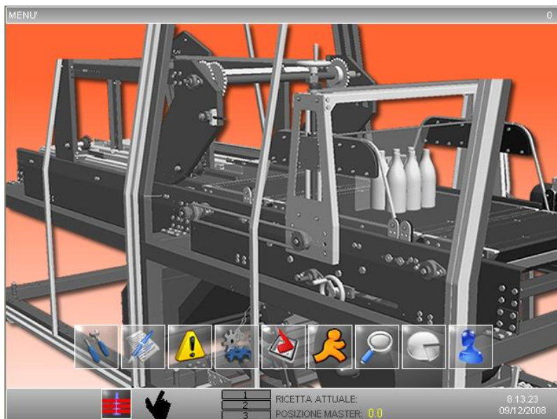
Grafica accattivante, semplice ed intuitiva per le macchine di Kosme, grazie alle soluzioni tecnologiche di Movicon 11.

possibilità di scelta con solo film, solo vassoio, film + vassoio o film + falda. Il formato dei contenitori producibili è estremamente ampio nelle forme e nel tipo di materiale supportato (bottiglia, lattina, flacone, vaso nei diversi materiali PET, vetro, alluminio ecc.). La macchina Flypack, che rientra nella gamma delle macchine a velocità 45 ppm, rappresenta un perfetto esempio della ricerca Kosme, che unisce innovazione tecnica alla massima qualità.